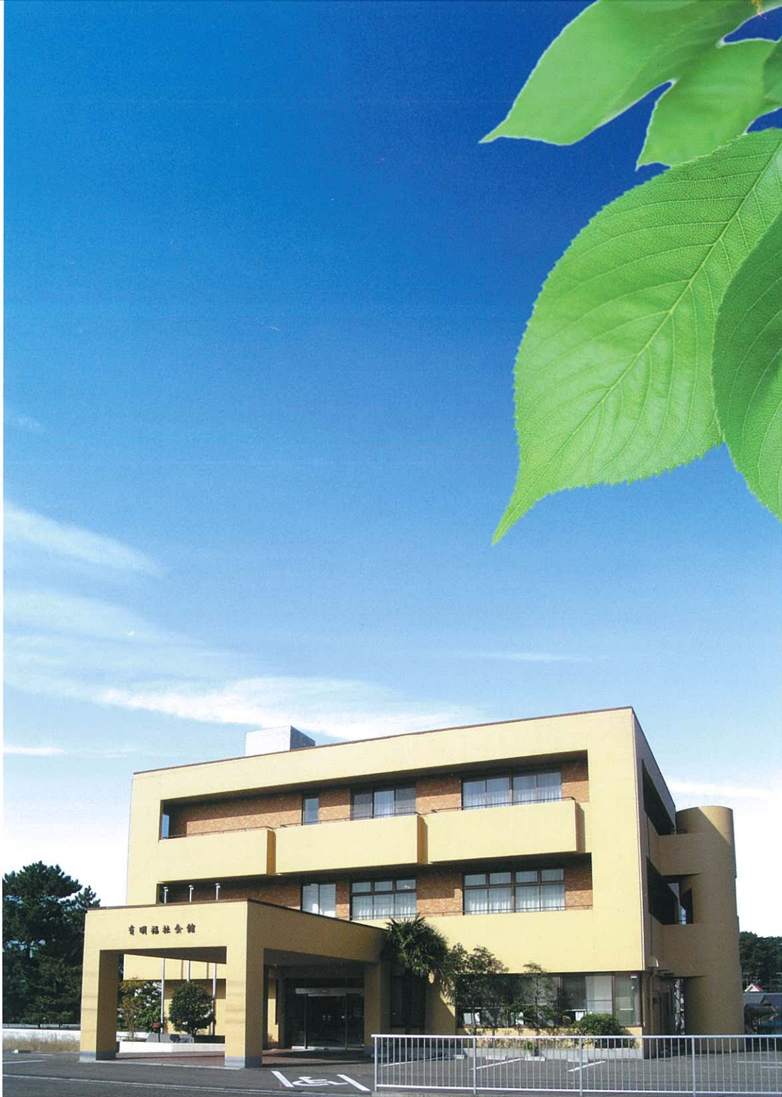
本部棟（有明福社会館）