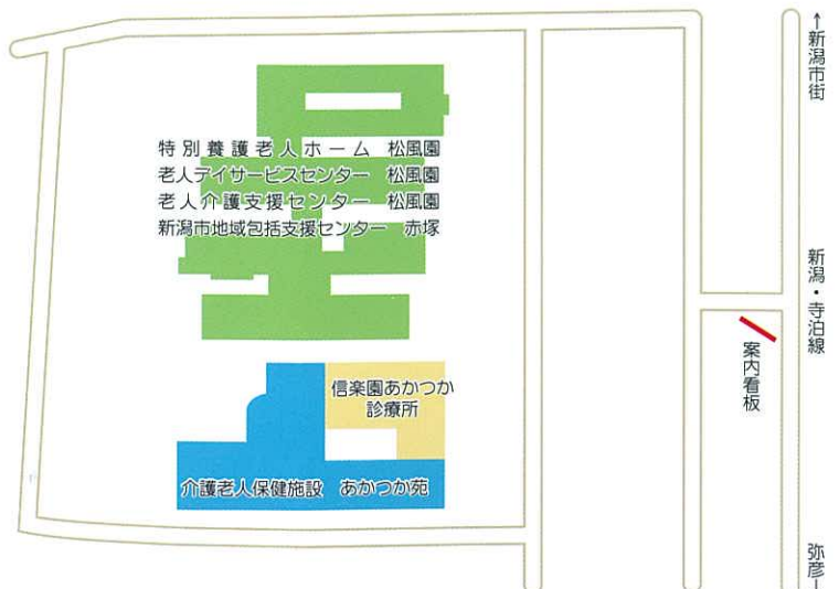
あかつか福祉タウン 配置図

協会本部から西に約15km、角田山・弥彦山を眺望できる赤塚地区に、特別養護老人ホーム・診療所・介護老人保健施設が隣接する福祉拠点